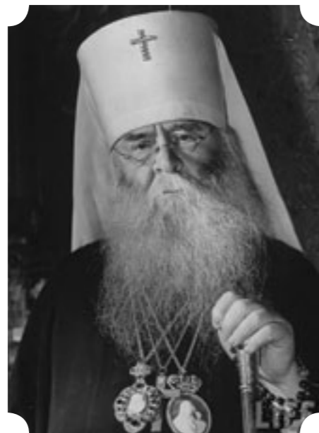
митрополит Сергей (Страгородский)

Дивеевского монастыря». Будучи знатоком церковного пения и сочинителем духовной музыки, он уделял много времени занятиям с церковным хором. Одновременно мудрый архипастырь все глубже погружался в раздумья относительно тяжелого положения Церкви. После смерти Патриарха Тихона (+7 апреля 1925 года) прибывшие на его погребение архиереи вскрыли завещание почившего, в котором он передавал патриаршие права и обязанности до законного выбора Патриарха митрополиту Казанскому Кириллу, а в случае невозможности ему исполнять эти обязанности – митрополиту Ярославскому Агафангелу