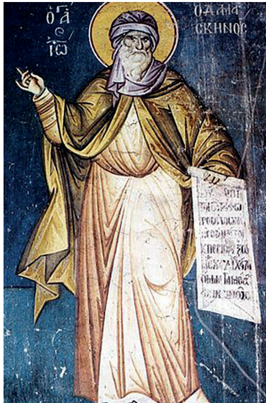
Преподобный Иоанн Дамаскин

учит: «если язычники вместе с умирающими сожигают их имение, то кольми паче ты, верующий, вместе с верующим, должен предпослать его имение не для того, чтобы оное превратилось в пепел, подобно тому, но дабы чрез него доставить большую славу усопшему; и если умерший был грешник, то дабы Бог отпустил ему прегрешения, а если праведник, дабы увеличил награды... Постараемся же оказывать чрез милостыни и приношения возможную помощь отшедшим, и это для них весьма спасительно, приносит великую пользу, ибо иначе напрасно и безрассудно было бы учреждено и Церкви Божией предано от премудрых апостолов, чтобы священник при страшных тайнах приносил молитву об усопших в вере, если бы святые апо-